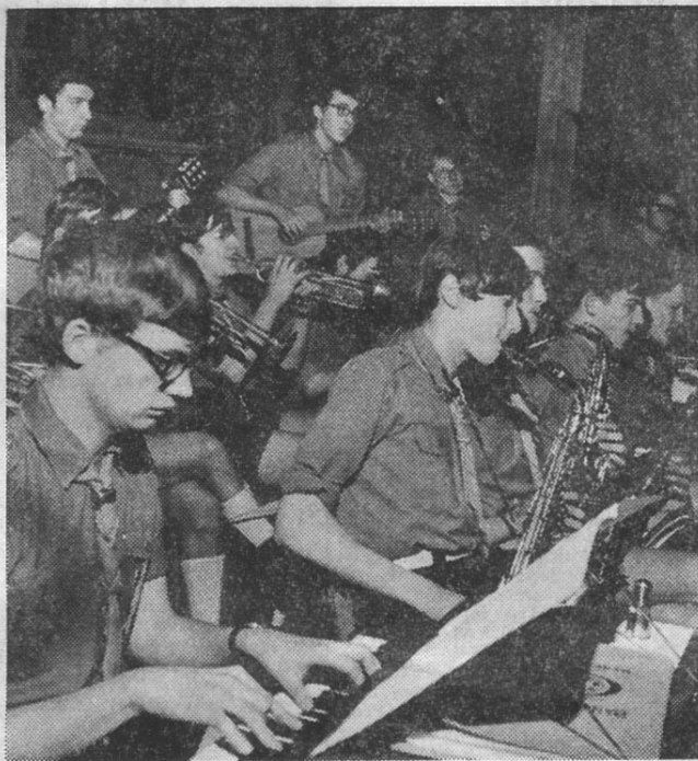
Het Banjo-orkest van Vlaamse Studenten: geslaagde Zwitserse concertreis

Het Banjo-orkest van Vlaamse Studenten, dit is de naam van het flinke ensemble van het St. Aloysiuskollege van Menen, heeft zijn fijne kunstzin, en de kunde van ons Vlaamse volk weer eens met groot succes buiten onze grenzen laten aanhoren. De zesde buitenlandse vakantiereis werd dit jaar 'n tweede Zwitserland-toernee nl. naar Wallis, alwaar in verscheidene steden tien concerten werden uitgevoerd.